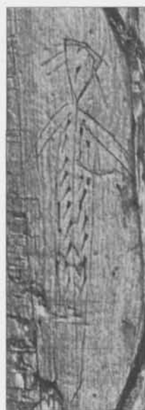
Fig. 3. Den människoliknande figuren med möjlig fjäderdräkt. Efter Andersen 1971, s. 20. — The humanoid figure in its feather-like garment.

långt borta (Strömbäck 1935, s. 124, 142 ff., 153). Sejden har genom Strömbäck's avhandling inte bara kunnat kopplas till hamnskifte, utan också genom dess extatiska inslag till shamanism (ibid., s. 160 f.). Genom extastillstånd kunde en person byta skepnad och bli ett djur (t. ex. en fågel) eller en demonisk varelse (ibid., s. 163). För att kunna försätta sig i trans eller komma i extas var sånger av största vikt, men även andra ljud användes som liknats vid människors röster eller sång, såsom suerds songr , våpna galdr och odda messa (ibid., s. 119). Ett annat ljud som kan ha använts i extassyfte är det från en flöjt (jfr. Eliade 1954). Hemdrup-staven har, som påpekats ovan, en flöjtliknande tillskärning i den tjockare änden. Flöjter från järnåldern med liknande tillskärning har bl. a. återfunnits i ett kärr i Vesterbølle på Jylland (Vestergaard Nielsen 1951, s. 145 f.) och i Svarta Jorden på Björkö (Oldeberg 1950, s. 51 ff.). Notabelt är också ordet vardlok(k)ur , som dels tolkats som den sång som användes för att återkalla shamanens själ till den fysiska kroppen, men som dels också identifierats med orden »ande«/»själ« ( vard ) och »slaa«/»lukkepind« ( -lokur/loka ) – alltså den pinne eller slå med vilken anden eller själen låstes fast, eller med vilken anden inneslöt (Strömbäck 1935, s.